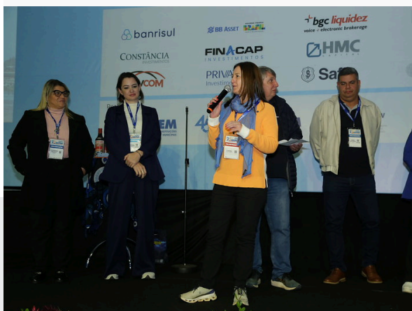
58º CONGRESSO NACIONAL DA ABIPEM