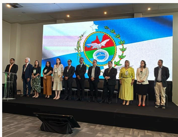
3º CONGRESSO NACIONAL DE CONSELHEIROS PREVIDENCIÁRIOS E GESTORES PÚBLICOS - ANEPREM