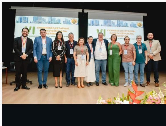
VI CONGRESSO ESTADUAL DE PREVIDÊNCIA – ASPREVPB