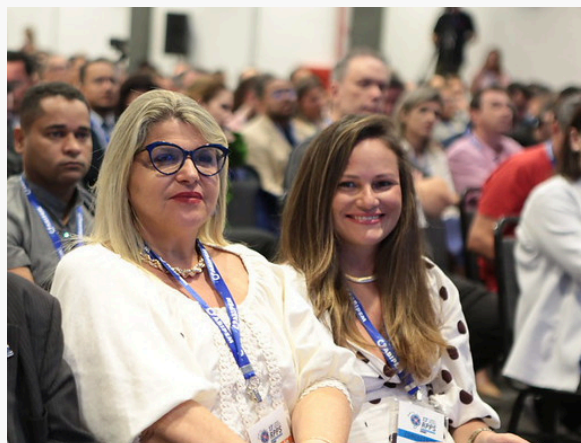
13º CONGRESSO BRASILEIRO DE CONSELHEIROS DE RPPS – ABIPEM