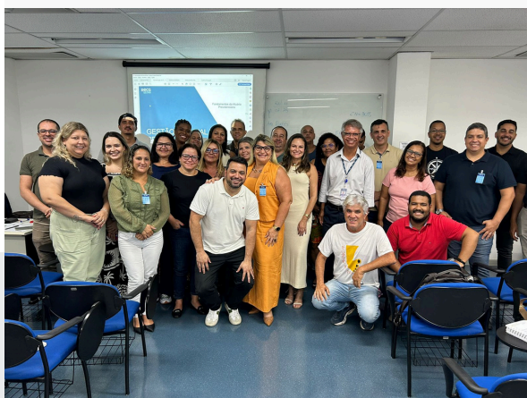
CURSO RPPS PARA NOVOS GESTORES - ECG TCE-RJ