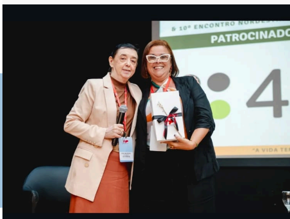
VI CONGRESSO ESTADUAL DE PREVIDÊNCIA – ASPREVPB