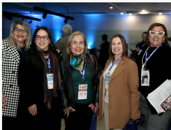
58º CONGRESSO NACIONAL DA ABIPEM