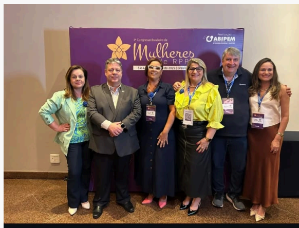
3º CONGRESSO BRASILEIRO DE MULHERES – ABIPEM