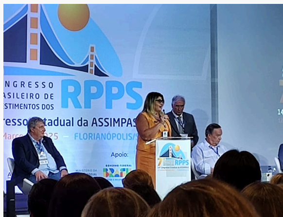
7º CONGRESSO BRASILEIRO DE INVESTIMENTOS DOS RPPS – ABIPEM