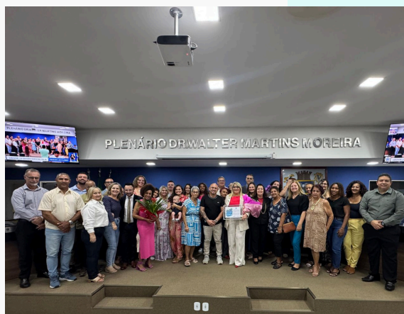
MOÇÃO DE APLAUSOS E LOUVOR NA CÂMARA MUNICIPAL DE ITATIAIA