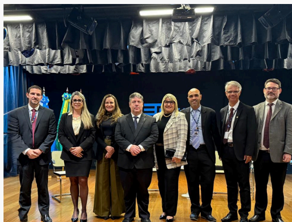
VI SEMINÁRIO DE RPPS TCE-RJ