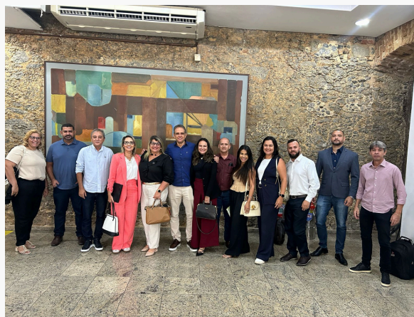
SEMINÁRIO: INÍCIO DE MANDATO, ORIENTAÇÕES AOS GESTORES TCE-RJ