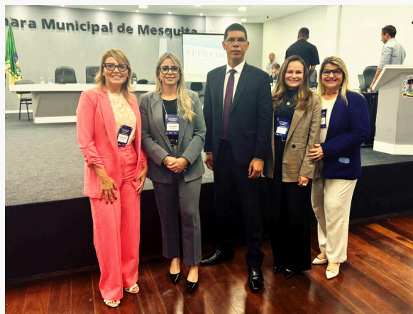
I FORUM REGIONAL DE GESTORES DE RPPS DA BAIXADA FLUMINENSE