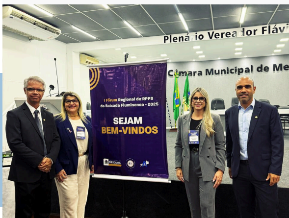
I FORUM REGIONAL DE GESTORES DE RPPS DA BAIXADA FLUMINENSE