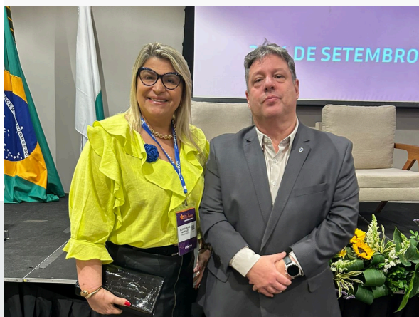
3º CONGRESSO BRASILEIRO DE MULHERES – ABIPEM