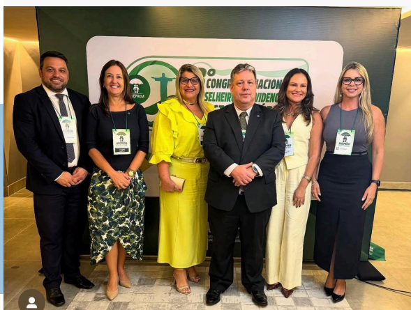
3º CONGRESSO NACIONAL DE CONSELHEIROS PREVIDENCIÁRIOS E GESTORES PÚBLICOS - ANEPREM