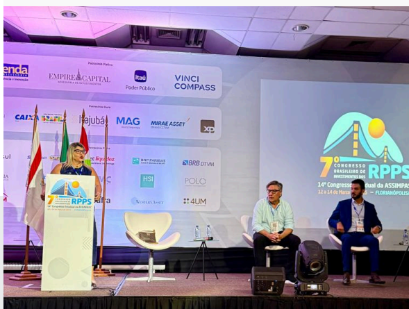
7º CONGRESSO BRASILEIRO DE INVESTIMENTOS DOS RPPS – ABIPEM