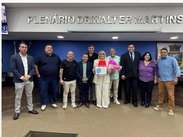
MOÇÃO DE APLAUSOS E LOUVOR NA CÂMARA MUNICIPAL DE ITATIAIA