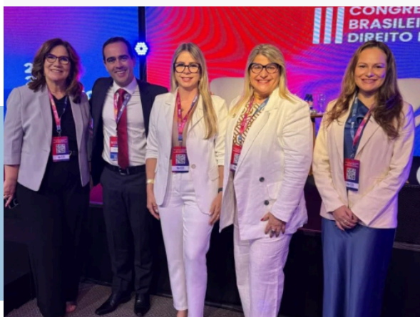
CONGRESSO BRASILEIRO DE DIREITO PREVIDENCIÁRIO - ICDS