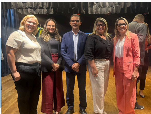
SEMINÁRIO: INÍCIO DE MANDATO, ORIENTAÇÕES AOS GESTORES TCE-RJ