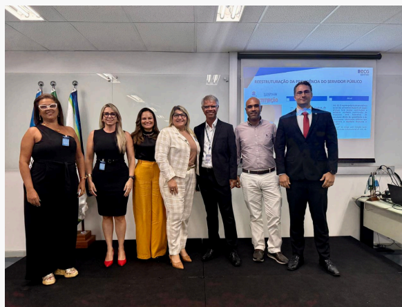
CURSO RPPS PARA NOVOS GESTORES - ECG TCE-RJ