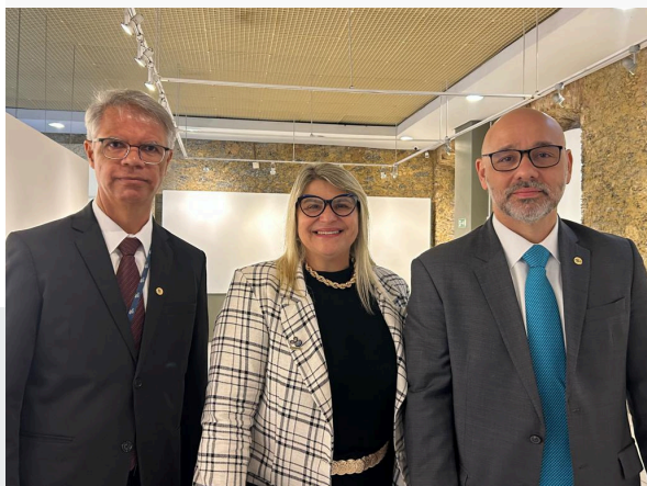
VI SEMINÁRIO DE RPPS TCE-RJ