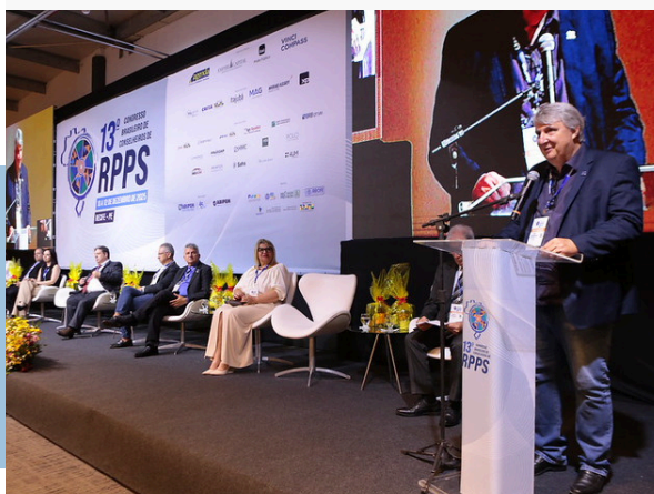
13º CONGRESSO BRASILEIRO DE CONSELHEIROS DE RPPS – ABIPEM